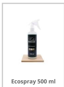
Ecospray 500 ml